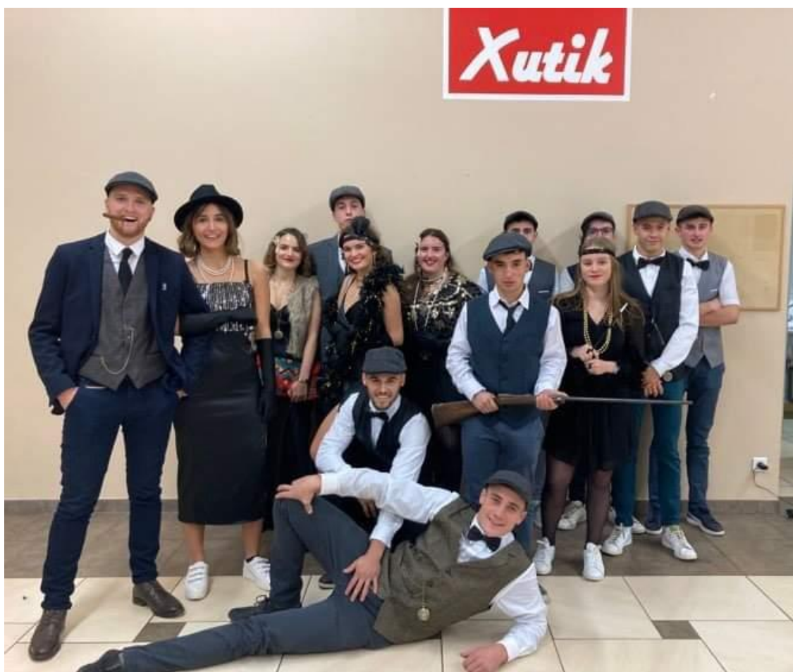
Le Comité BETI-XUTIK